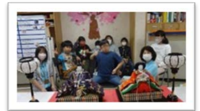
地域の方からお譲りいただきました。